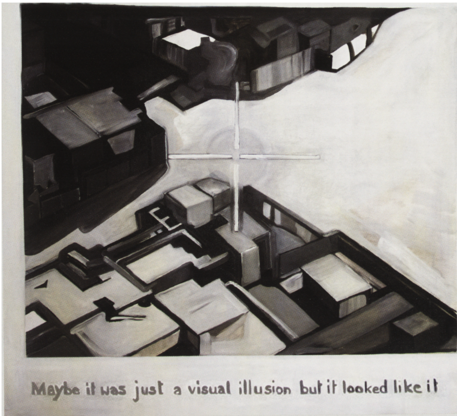
Ewa Bobrowska, Maybe it was just a visual illusion , olej na płótnie, 75 x 80, 2010