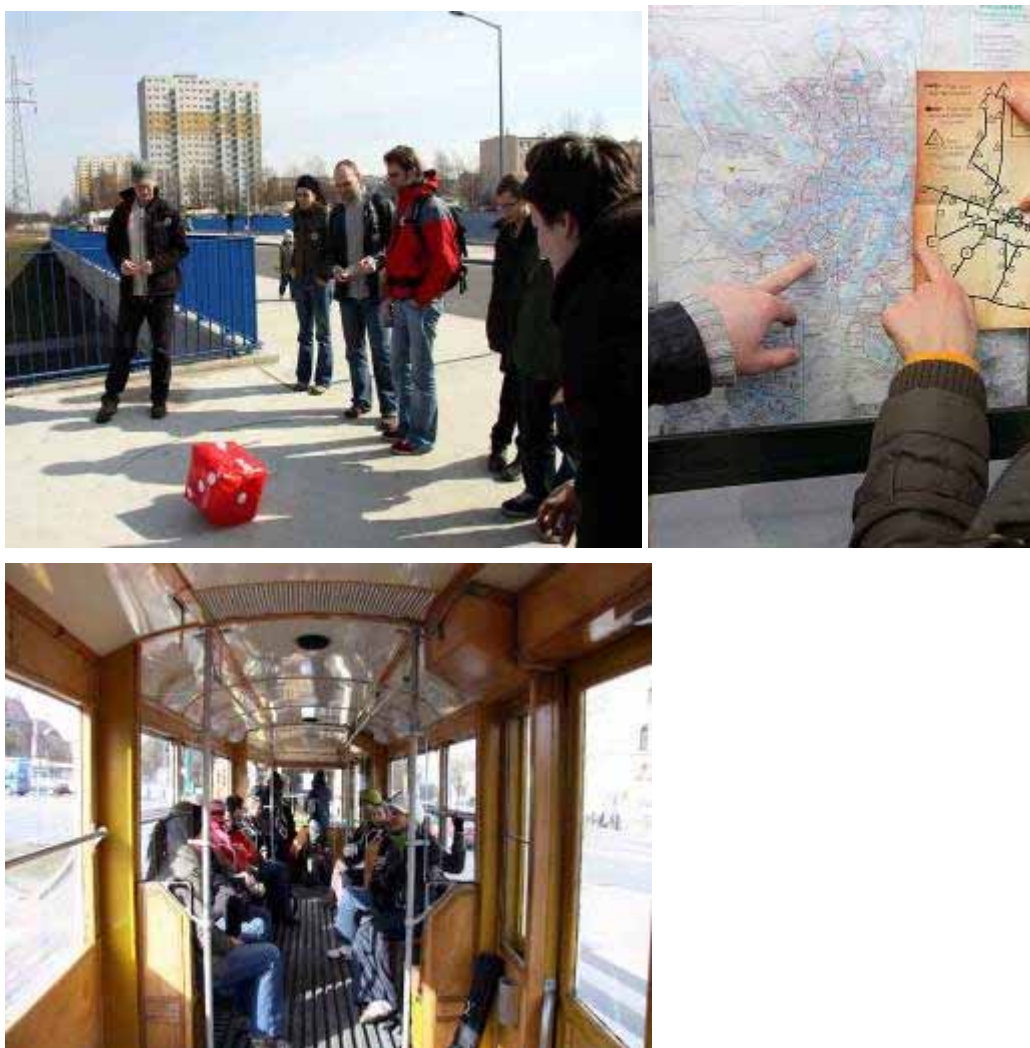
Fot. 3, 4, 5. Przykład gry miejskiej. XIV edycja Gry Miejskiej Miasta Poznania, jednocześnie pierwsza w Polsce miejska gra tramwajowa