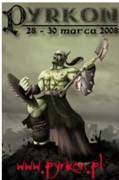
Fot. 6. Plakat Najlepszego Konwentu Roku. Pyrkon 2008 w Poznaniu

Jednym z najbardziej popularnych konwentów jest Pyrkon, organizowany corocznie w Poznaniu, który w roku 2008 otrzymał nagrodę Najlepszy Konwent Roku. Celem konwentu jest propagowanie fantastyki w literaturze, komiksie, filmie oraz w grach: komputerowych, RPG, planszowych, karcianych i bitewnych. Dodatkowo celem konwentu jest integracja fanów i twórców fantastyki. Konwent charakteryzuje bardzo bogaty program (ponad 300 godzin prelekcji oraz atrakcje ciągłe). Informacje o wszystkich konwentach organizowanych w kraju można uzyskać na stronie Informatora Konwentowego: www.informator.rpg.pl .