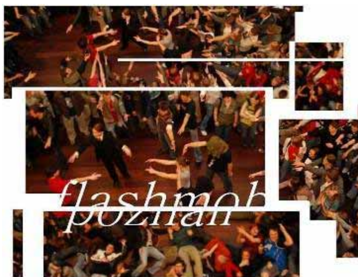
Fot. 8. Największy flash mob w Polsce. „Bang! Bang!” 12.05.2007 Stary Browar Poznań

Określenie (dosłownie ang. „błyskawiczny tłum”), którym przyjęło się nazywać sztuczny tłum ludzi gromadzących się niespodziewanie w miejscu publicznym w celu przeprowadzenia krótkotrwałego zdarzenia, zazwyczaj zaskakującego dla przypadkowych świadków. W akcji uczestniczą nieznani sobie ludzie znający jedynie jej termin i planowane działanie. Zazwyczaj akcje takie organizowane są za pośrednictwem internetu lub SMS-ów.