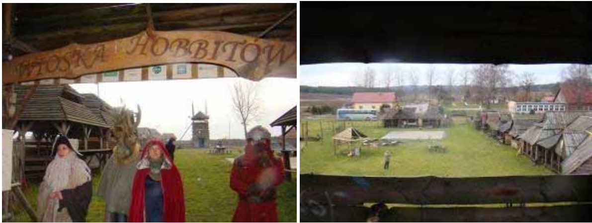
Fot. 1 i 2. Przykład wykorzystania elementów gry terenowej w produkcie turystycznym. Wioska Hobbitów – projekt wioski tematycznej w Sierakowie Sławieńskim