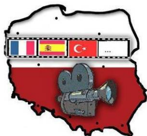
Rys. 2. Logo produktu

która poprzez umieszczenie w poszczególnych klatkach filmowych flag różnych państw europejskich i nie tylko, ma za zadanie zaznaczyć, iż produkt dotyczy filmów, w których pokazywane są zagraniczne miasta i obiekty. Dzięki umieszczonym na kliszy flagom potencjalny klient wie z góry, że szlak prezentuje filmy, w których pokazuje się miejsca czy miasta znajdujące się w Turcji, Hiszpanii czy Francji. Wie również (sygnalizuje to wielokropki), że nie są to jedyne kraje, których miejsca i obiekty są powiązane ze szlakiem.