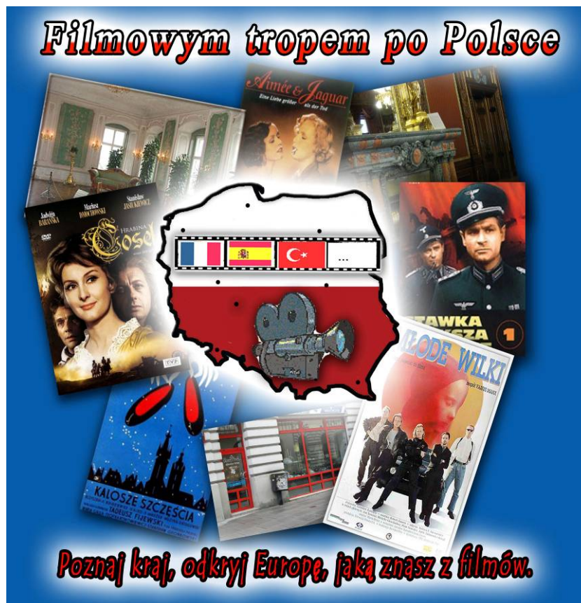
Rys. 6. Plakat