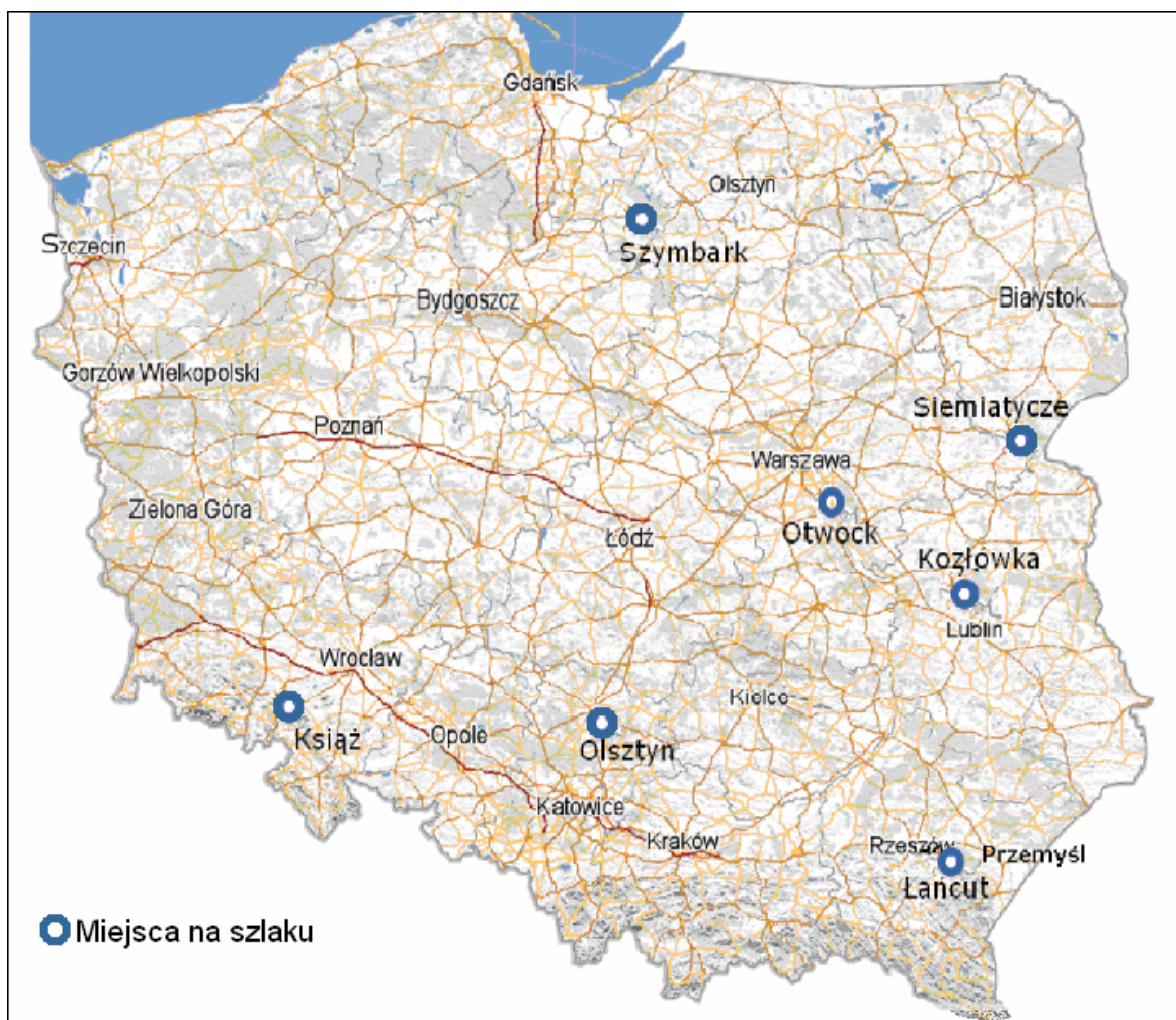
Mapa 1: Miejscowości, w których kręcono filmy, objęte projektem przykładowego produktu turystycznego