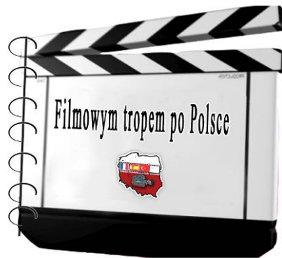
Rys.10. Folder

Folder dostarczałby jeszcze większej liczby informacji, których ilość, a także zawartość pozwoliłyby turystom swobodnie podążać filmowym szlakiem. Nietypowy kształt folderu miałby przyciągnąć uwagę turystów i odróżnić go od pozostałych materiałów informacyjnych. Zawartość natomiast (zdjęcie z filmu, nazwa i adres obiektu związanego z konkretnym filmem, krótka notka na temat powiązań z filmem i wskazówka-pomysł na ciekawe miejsce do odpoczynku) miałyby być rzetelnym źródłem wiedzy o szlaku, ułatwiającym jego zwiedzanie. Zarówno ulotki jak i foldery można by było bezpłatnie pobierać w punktach Informacji Turystycznej. Folder zaprezentowany jest na rysunku 10.