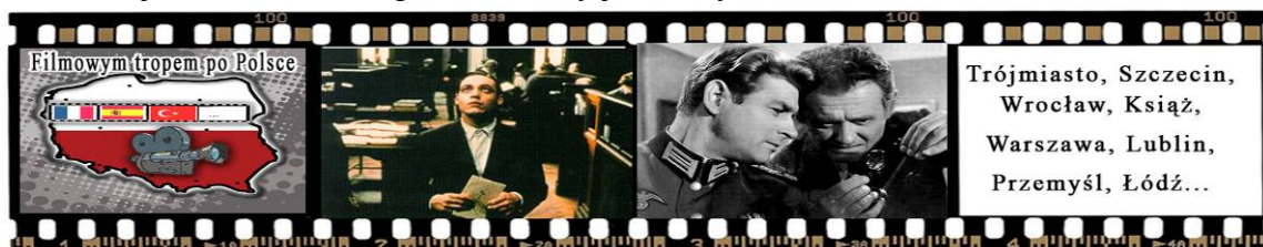
Rys. 7. Baner reklamowy

Wspomniany baner reklamowy to graficzny element reklamowy, który jest umieszczany centralnie na górze strony internetowej. Kliknięcie w niego powoduje automatyczne przejście do reklamowanego serwisu. W przypadku baneru dotyczącego projektowanego produktu kliknięcie w jedną z czterech części kliszy (logo szlaku, kadr z filmu lub nazwę któregoś z miast) spowodowałoby automatyczne przejście do strony internetowej szlaku. Baner zaprezentowany jest na rysunku 7.