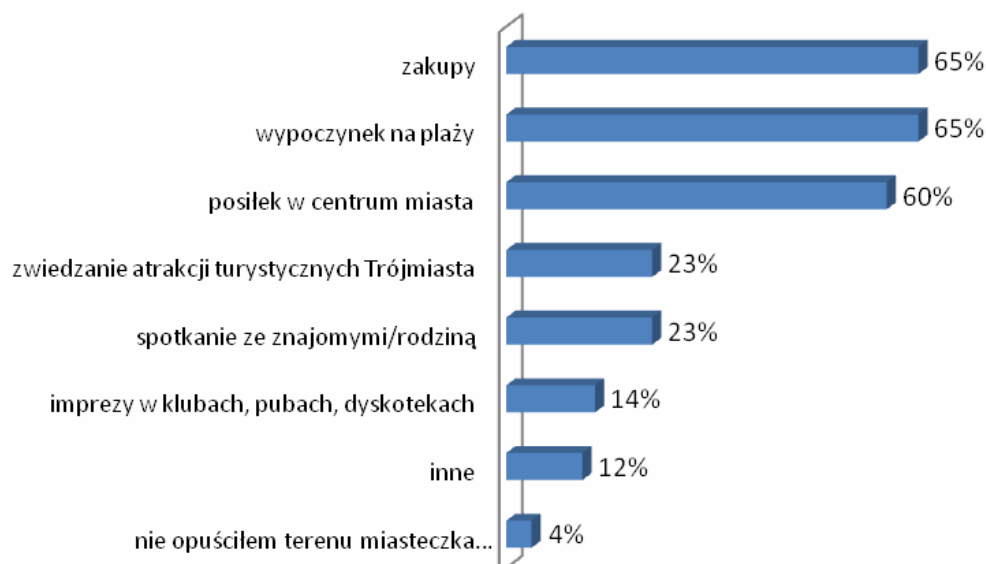
Ryc. 3. Aktywność uczestników Heineken Open`er poza terenem miasteczka festiwalowego