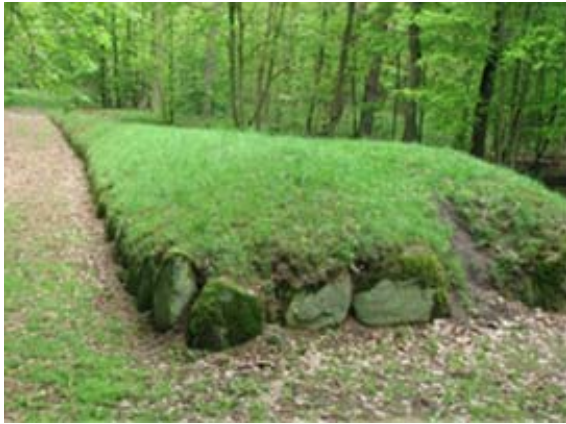
Ryc.7. Grobowiec nr 5 w Wietrzychowicach

natomiast jest nr 5, w którego centralnym punkcie czoła znajdowało się wejście do komory kultowej, a w którym pochowano dwóch mężczyzn u których stwierdzono przeprowadzone zabiegi trepanacji czaszki. U jednego z mężczyzn zabiegu dokonano aż czterokrotnie (z powodu gruzliczych przerzutów do mózgu). Obaj przeżyli swoje operacje i przyznam że wydaje się to nieprawdopodobne przez pryzmat ówczesnych możliwości technicznych 18 .