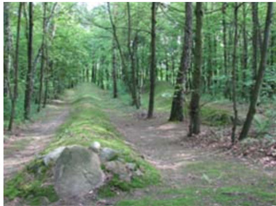
Ryc.8. Grobowiec nr 4 w Sarnowie

z nich odnaleziono pochówki więcej niż jednej osoby, np. w grobowcu nr 2: pięć pochówków 19 . Interesujący jest grobowiec nr 9, w którym znaleziono szkielet ułomnej kobiety, zmarłej w wieku 50 - 70 lat, pochowanej w trumnie wydrążonej z pnia drzewa, co stanowi wyjątkowe znalezisko ponieważ, jak dotąd, nie natrafiono na tak potężny grobowiec usypany dla jednej tylko osoby, i to kobiety (przypuszcza się, że musiała ona zajmować jakąś szczególną pozycję w hierarchii społecznej). Najciekawszym jednak jest grobowiec nr 7: pod jego nasypem odkryto pozostałości po grobach otoczonych kolistymi kręgami kamiennymi (prawdopodobnie pięciu), a w ścianie bocznej natrafiono na zarys jamy zawierającej szczątki 5-9 ludzi, którzy zostali zjedzeni w trakcie uczty obrzędowej 20 .