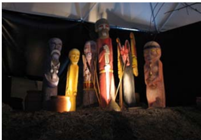
Ryc.2. : Fragment wystawy Mit Słowiański; w centrum Perun, od lewej: Chors, Dadźbog, Stribog, Siemargł, Mokosz