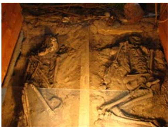
Ryc.10. Fragment ekspozycji archeologicznej w Kruszwicy (szkielet kobiety i chłopca)

Miejscowość znana jest przede wszystkim z Mysiej Wieży i osadnictwa Goplan, jednak warto poznać również kilka innych faktów na jej temat. Za wieżą mieści się ekspozycja archeologiczna – być może niezbyt nowoczesna, ale turystę poszukującego miejsc związanych z danymi kultami, przyciągająca zaprezentowanymi tu dwoma pochówkami: 30-letniej kobiety z ok. 4000 r. p.n.e. (przedstawicielki pierwszych rolników) i kilkunastoletniego chłopca z młodszej epoki kamienia (2575 r. p.n.e.). Funkcjonujące na terenie Kruszwicy i okolic cmentarzyska z epoki brązu i żelaza zostały zaprezentowane na planszach i makiecie 22 . Ponadto na murach romańskiej kolegiaty mieszczącej się na wschodnim brzegu jeziora Gopło zachowała się wyryta w kamieniu swastyka, czyli, jak już wspominałam, symbol związany z kultami pogańskimi, a dokładniej z kultem słońca. Jego obecność na kościele zbudowanym w 2 połowie XII w., świadczy o tym, że pogańskie praktyki magiczne po 200 latach od chrystianizacji były nadal żywe 23 .