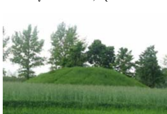
Ryc.6. Kurhan, Łęki Małe