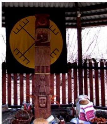
Ryc.3. Rzeźba Światowida i złożone mu dary; święto Jare, Chram Mazowiecki Rodzimego Kościoła Polskiego (neopaganie)

topiona lub palona [Ogrodowska 2001, s. 113]. Istniały zwyczaje w ramach których oblewano się wodą (by pola oblanej osoby nie cierpiały suszy) i obdarowywano jajkami (jak w innych kulturach będących symbolem życia i tego się rodzi), które wcześniej były barwione i ozdabiane symbolami słońca i płodności. By przyszłe plony były większe, zakopywano w ziemi resztki jedzenia i napojów pochodzących z uczty [Pełka 1989, s.75-76]. Po zniszczeniu Marzanny, symbolicznie wprowadzano wiosnę: śpiewająca młodzież chodziła z tzw. gaikiem, czyli zieloną gałązką zdobioną kolorowymi wstążkami, o czym pisał Jan Długosz nazywając ten obyczaj „starożytnym” i zabraniając go, jako że miał korzenie pogańskie [Ogrodowska 2005, s. 121].