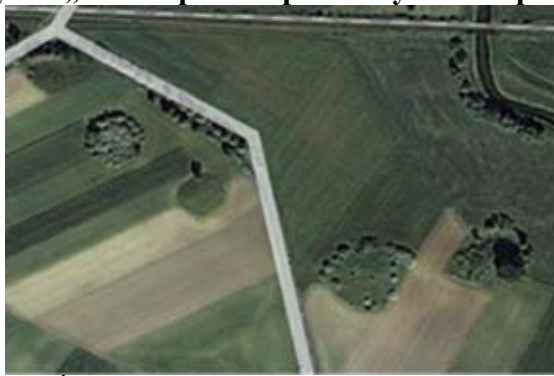
Ryc.5. „Wielkopolskie piramidy” z lotu ptaka