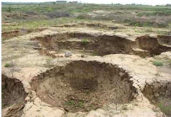
Ryc.9. Grobowiec nr 4 w Sarnowie

rzeczywiście nim będącą tkaninę. Znamiona kultu miały takie zachowania jak te, że obok lewej ręki zmarłego układano nóż (typowym dla Słowian było wyposażenie zmarłego w broń), a w usta, pod język wkładano monetę, która miała być ofiarą dla Welesa, słowiańskiego boga zaświatów, wyprowadzającego duszę na łąki Nawii 21 (niczym w starożytnej Grecji, gdzie zmarłym wkładano w usta pieniądze dla Charona, przepływającego umarłych przez rzekę Styks, którą należało przepłynąć łódką by dostać się do Hadesu).