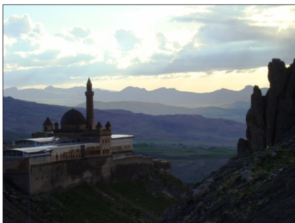
Fot. 2. Widok na Ishak Paşa Sarayı .

z umieszczonymi wokół nich budynkami różnorakiego przeznaczenia. Część mieszkalna pałacu Ishak Paşa składa się z dwóch pięter, na których usytuowano ponad 300 pomieszczeń, zaś w każdym z nich pierwotnie znajdował się kamienny kominek. Wnęki w kamiennych ścianach natomiast wskazują na to, iż budynek jako całość posiadał system centralnego ogrzewania, a także kanalizację i bieżącą wodę.