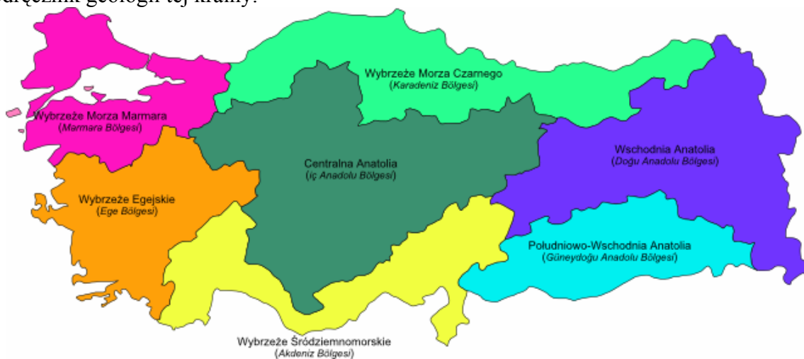
Mapa 1. Podział Turcji na regiony geograficzno-klimatyczne.