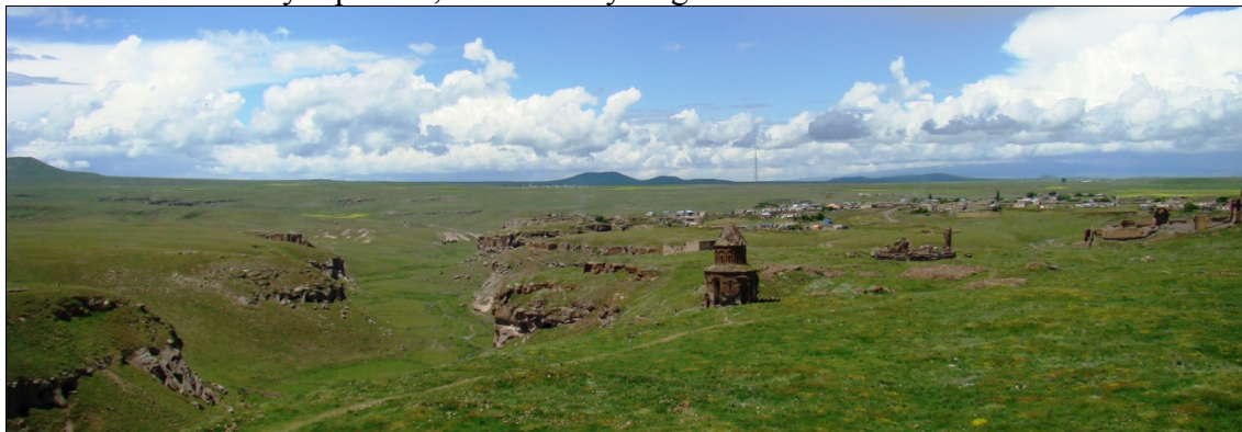
Fot. 3. Ruiny Ani.

„Miasto tysiąca i jednego kościoła” – Ani – to zrujnowane i opuszczone miasto w prowincji Kars na wschodzie Turcji, odzwierciedlające tragedię narodu ormiańskiego (fot. 3). W czasach swojej świetności była to przepiękna stolica Armenii licząca od ponad 100 do ok. 200 tysięcy mieszkańców, która swoją potęgą i atrakcyjnością nie ustępowała ówczesnemu Konstantynopolowi, Kairowi czy Bagdadowi.