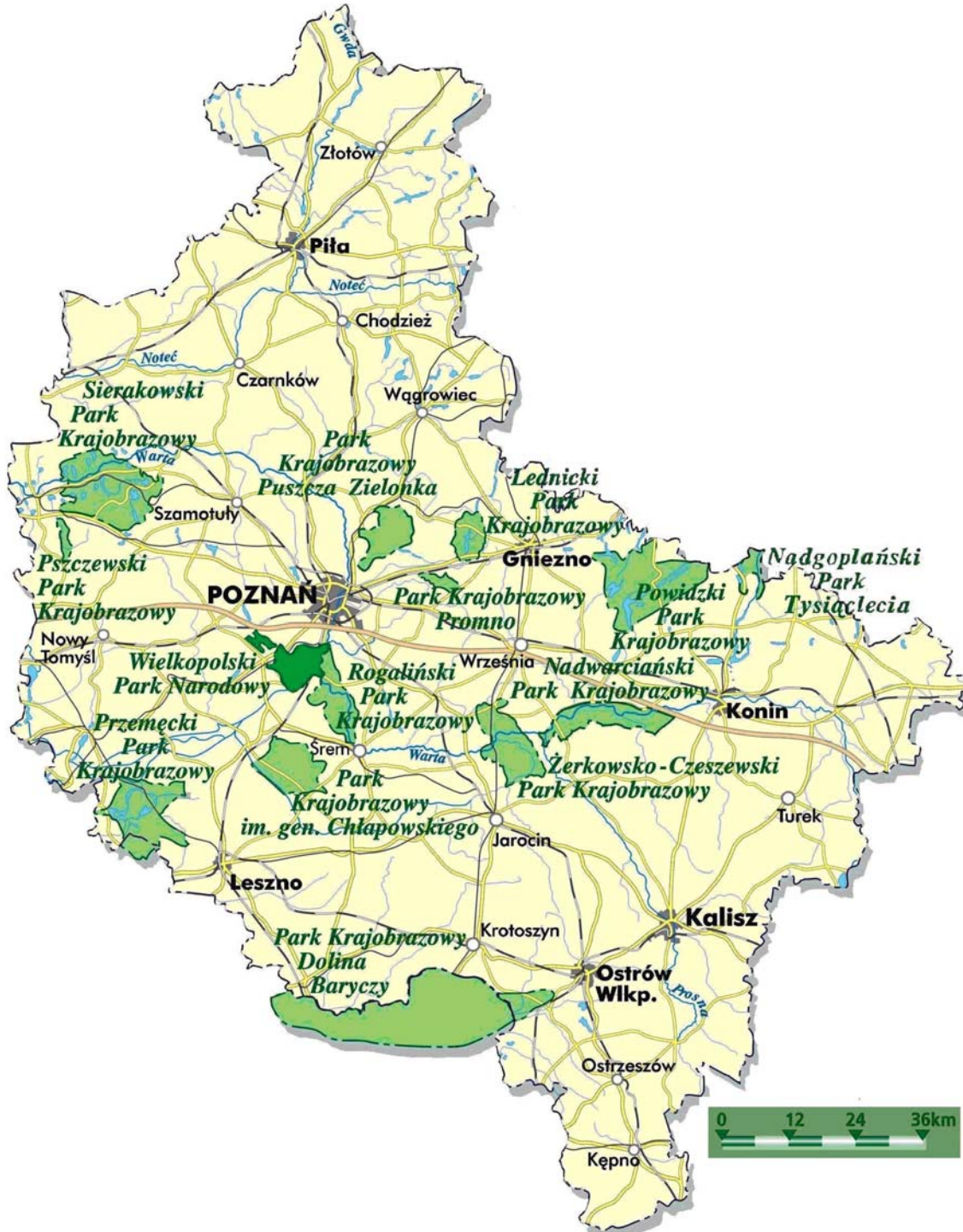
Ryc. 1. Lokalizacja wielkopolskich parków krajobrazowych

Cechą charakterystyczną omawianych obszarów jest znaczne zróżnicowanie pod względem struktury gruntów. W większości parków dominującą formą użytkowania powierzchni są użytki rolne, natomiast w trzech lasy (powyżej 50%), zaś udział wód waha się od 0,7% do prawie 14% [Uglis 2010b, s. 79].