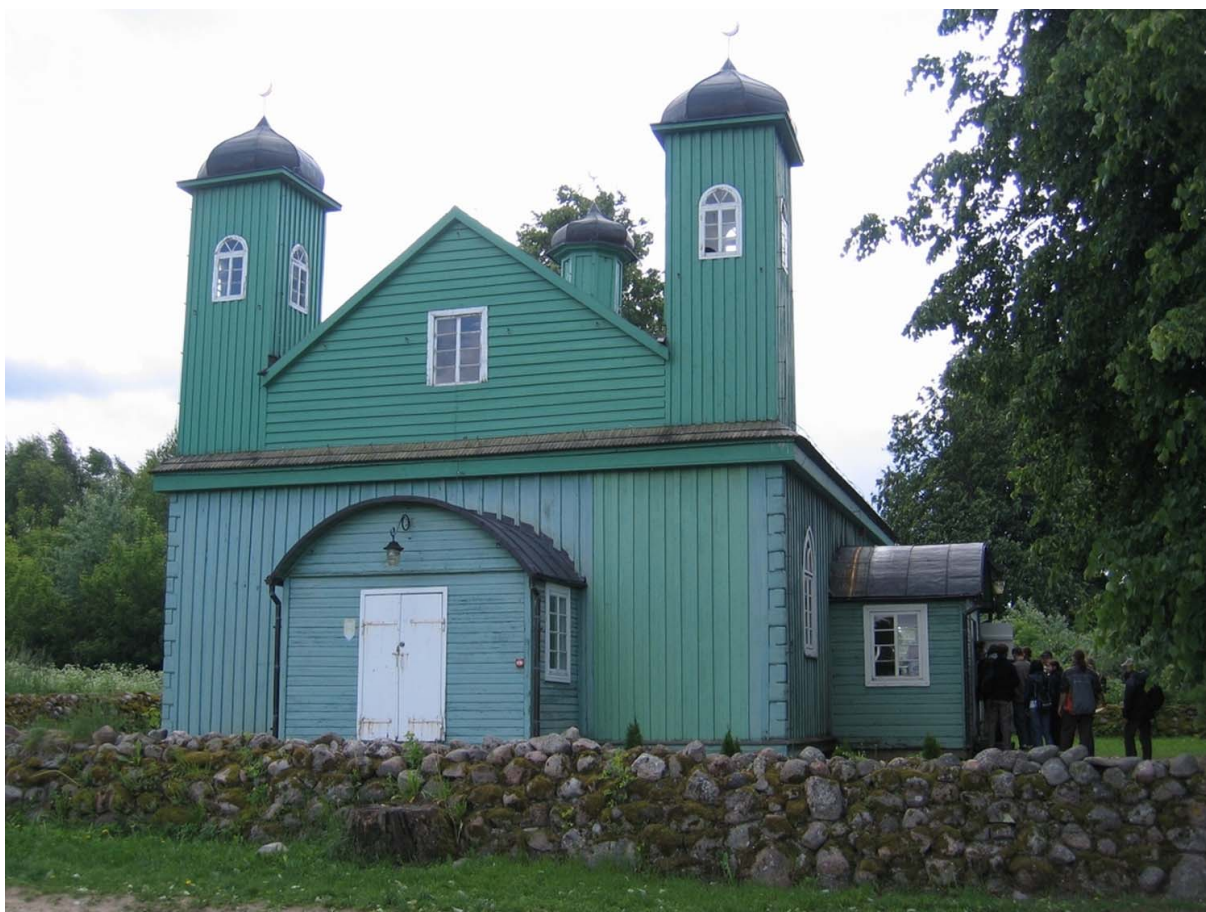
Fot. 5 – Meczet w Kruszynianach na Szlaku Tatarskim