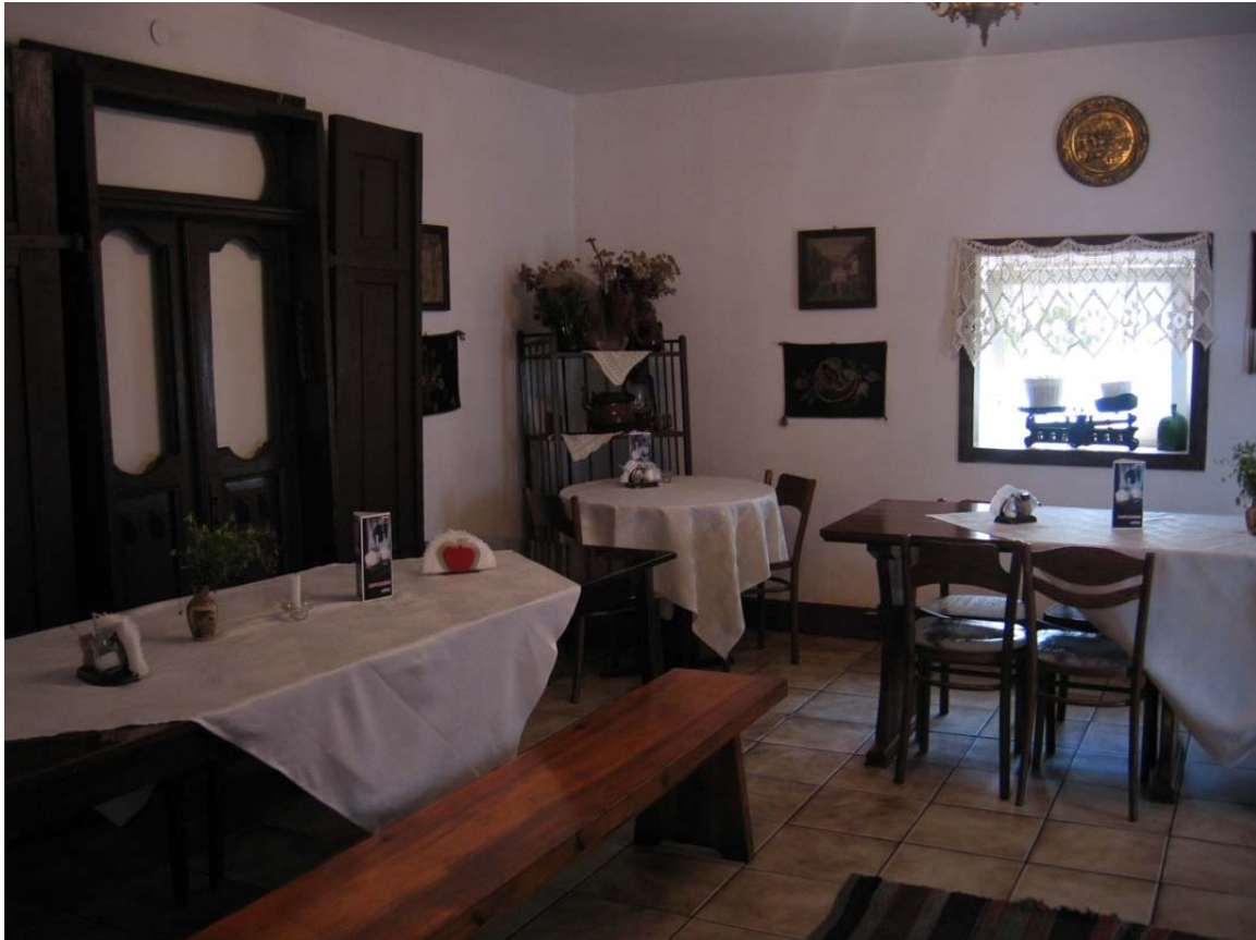
Fot. 7 – Restauracja „Tejsza” w Tykocinie

Warto jednak wspomnieć, że obecnie w podziemiach dawnego Domu Talmudycznego mieści się restauracja „Tejsza”, serwująca potrawy kuchni żydowskiej. Nazwa restauracji jest nieprzypadkowa, ponieważ w języku jidysz oznacza kozę, która dla podlaskich Żydów była symbolem dostatku. W menu „Tejszy” wyróżniają się dania żydowskie, m.in. cymes, kugel, kreplach itp. Mimo nie w pełni widocznego wejścia, restauracja cieszy się dużym zainteresowaniem przyjezdnych, zarówno z Polski jak i ze świata.