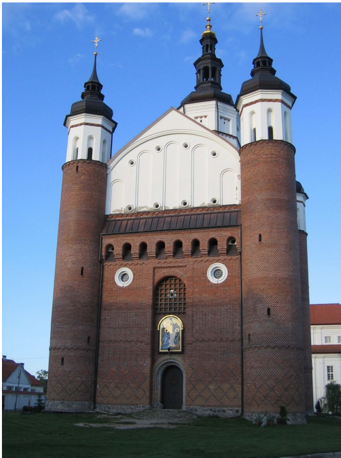
Fot. 4 - Cerkiew pw. Zwiastowania NMP – przykład połączenia architektury wschodu i zachodu

Źródło: fot. Małgorzata Durydiwka (maj 2009)