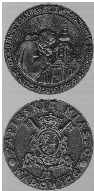
Awers i rewers pamiątkowego medalu.