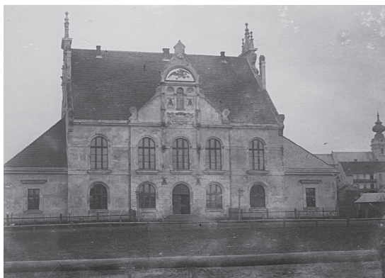
Budynek „Sokoła” na fotografii z początku XX w.

Zaraz po wybraniu kierownictwa przedsięwzięcia, miasto ofiarowało bezpłatnie teren pod budowę o powierzchni 2144 m 2 . Opracowano plan. Według tego pierwszego planu budynek miał być utworzony ze ścian ryglowych i kosztować około 5000 zł. Komitet budowy zmienił jednak pierwotne zamierzenie. Przyczyną zmiany planów była chęć pomocy materialnej mieszkańców oraz