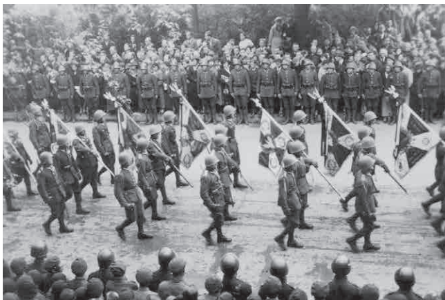
Poczet sztandarowy 12 pp na pogrzebie marsz. J. Piłsudskiego w Krakowie (trzeci od prawej)

Zgodnie z ówczesnym obyczajem portrety dostojników państwowych zdobyły pomieszczenia urzędowe, a więc także sale lekcyjne. W latach 1926-1935 praktycznie w każdej klasie szkolnej poniżej krzyża i godła państwowego widniały portrety Marszałka i Prezydenta RP, prof. Ignacego Mościckiego, zaś po śmierci J. Piłsudskiego jego portret zawieszano często w środku, pomiędzy wizerunkami I. Mościckiego i nowego Generalnego Inspektora Sił Zbrojnych, gen. dywizji a później marszałka, Edwarda Rydza-Śmigłego. Ten sam obyczaj panował w obiektach wojskowych oraz lokalach większości organizacji kombatanckich.