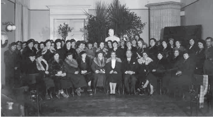
Zebranie Rodziny Wojskowej 12 pp ze starostą wadowickim z okazji rocznicy imienin komendanta w sali recepcyjnej Kasyna Oficerskiego 12 pp (marzec 1937)

w „Sprawozdaniach” Państwowego Gimnazjum im. Marcina Wadowity od r. 1926 odnotowywane są systematycznie informacje o obchodach imienin Marszałka, a po śmierci J. Piłsudskiego także w obchodach rocznicy jego zgonu. Sprawozdania szkolne odnotowują wreszcie pod datą 13 czerwca 1935 r. udział uczniów Gimnazjum w pokazie filmu z uroczystości żałobnych, a w październiku 1935 r. wycieczkę uczniów dla sypnia Kopca J. Piłsudskiego na Sowińcu w Krakowie. Informacje o obchodach rocznicy odzyskania niepodległości notowane są od 1920 r., a święta 3 maja od 1918 r.