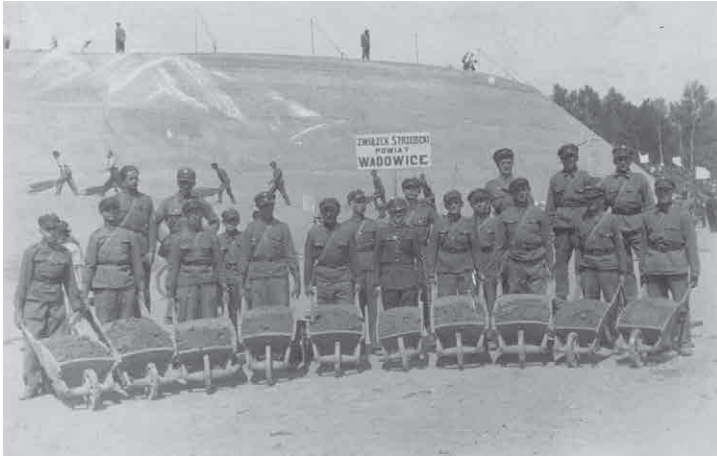
Strzelcy powiatu wadowickiego podczas sypania kopca na Sowińcu

Istotnym – a z racji swojej struktury i liczebności zapewne najpoważniejszym ośrodkiem kultu Czynu Niepodległościowego i osoby Józefa Piłsudskiego był miejscowy garnizon, czyli 12 Pułk Piechoty Ziemi Wadowickiej. W programie edukacji narodowej i państwowej żołnierzy postać Marszałka, jako twórcy Niepodległego Państwa Polskiego i jego Sił Zbrojnych eksponowana była niejako w sposób naturalny i oczywisty. Pomieszczenia reprezentacyjne pułku, m.in. kasyna oficerskie i podoficerskie zdobyły popiersia J. Piłsudskiego. To przed nimi wykonywano często pamiątkowe fotografie oraz odbywano zebrania okolicznościowe poświęcone Komendantowi i tradycji Czynu Niepodległościowego.