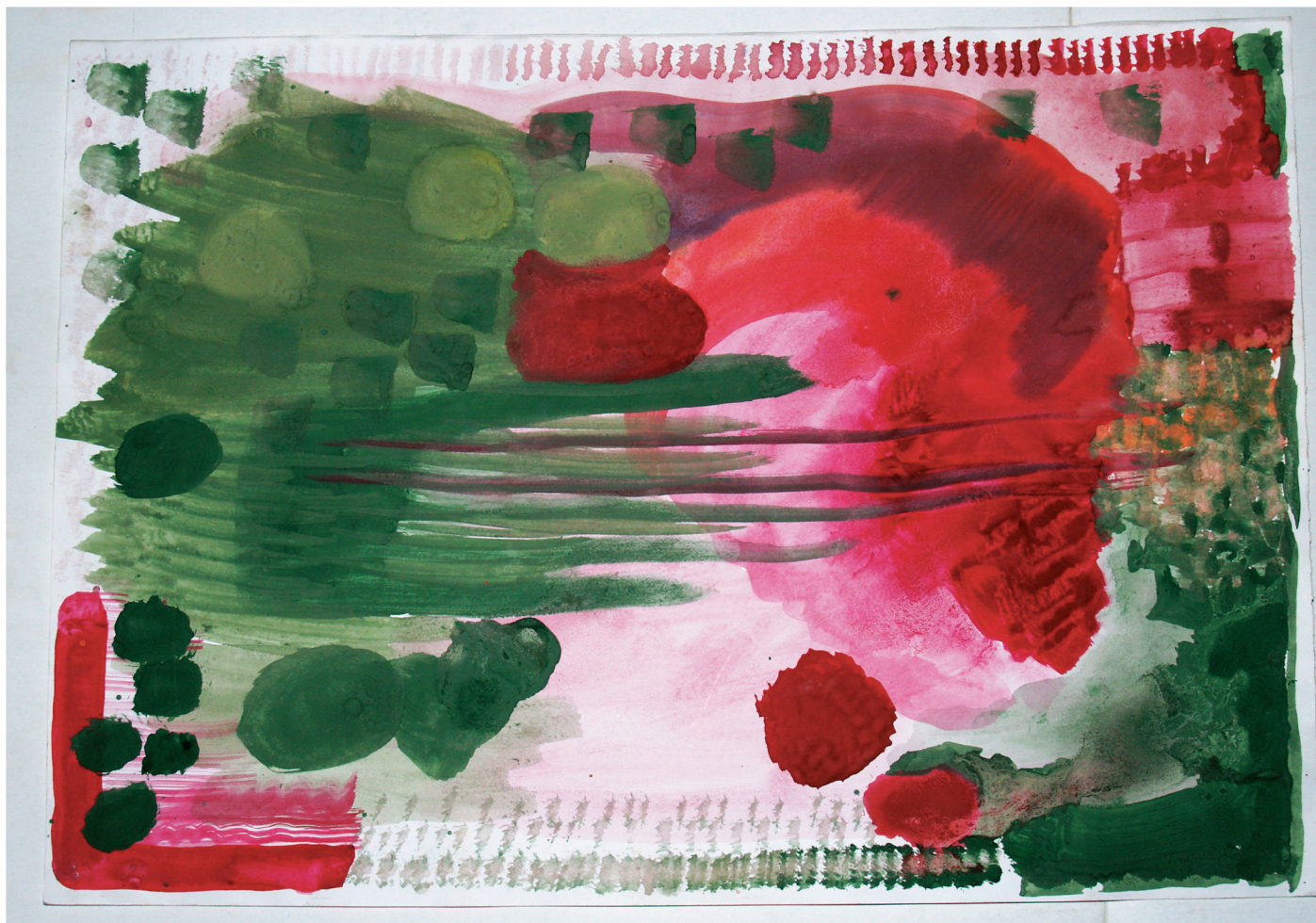
Rys. 4. Kontrast barw — Wojciech Ślepecki