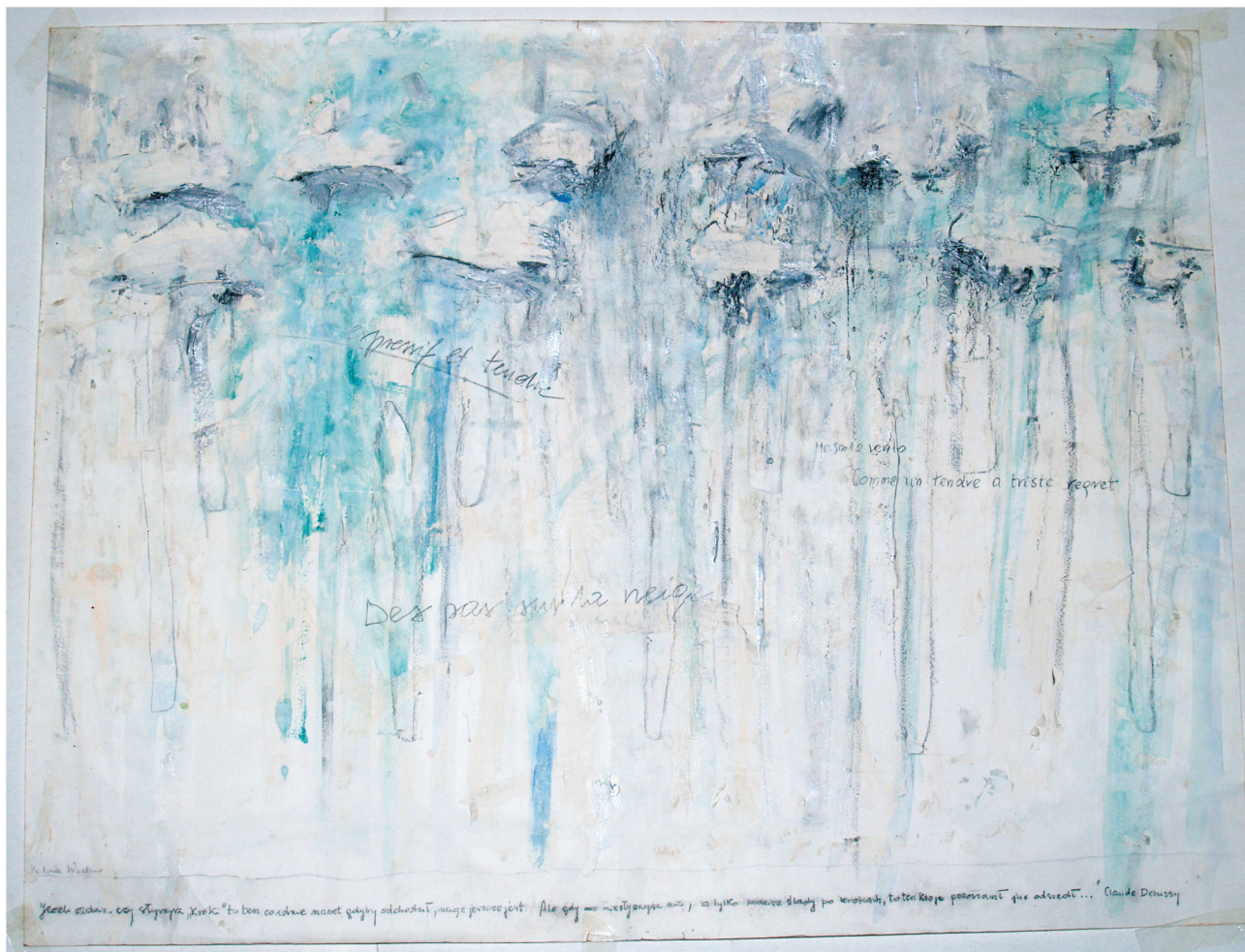
Rys. 6. Ekspresyjność środków artystycznych — Halina Błachnio