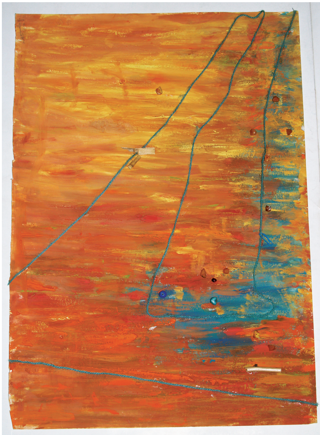
Rys. 5. Kolaż — jaka(i) jestem? — Halina Błachnio