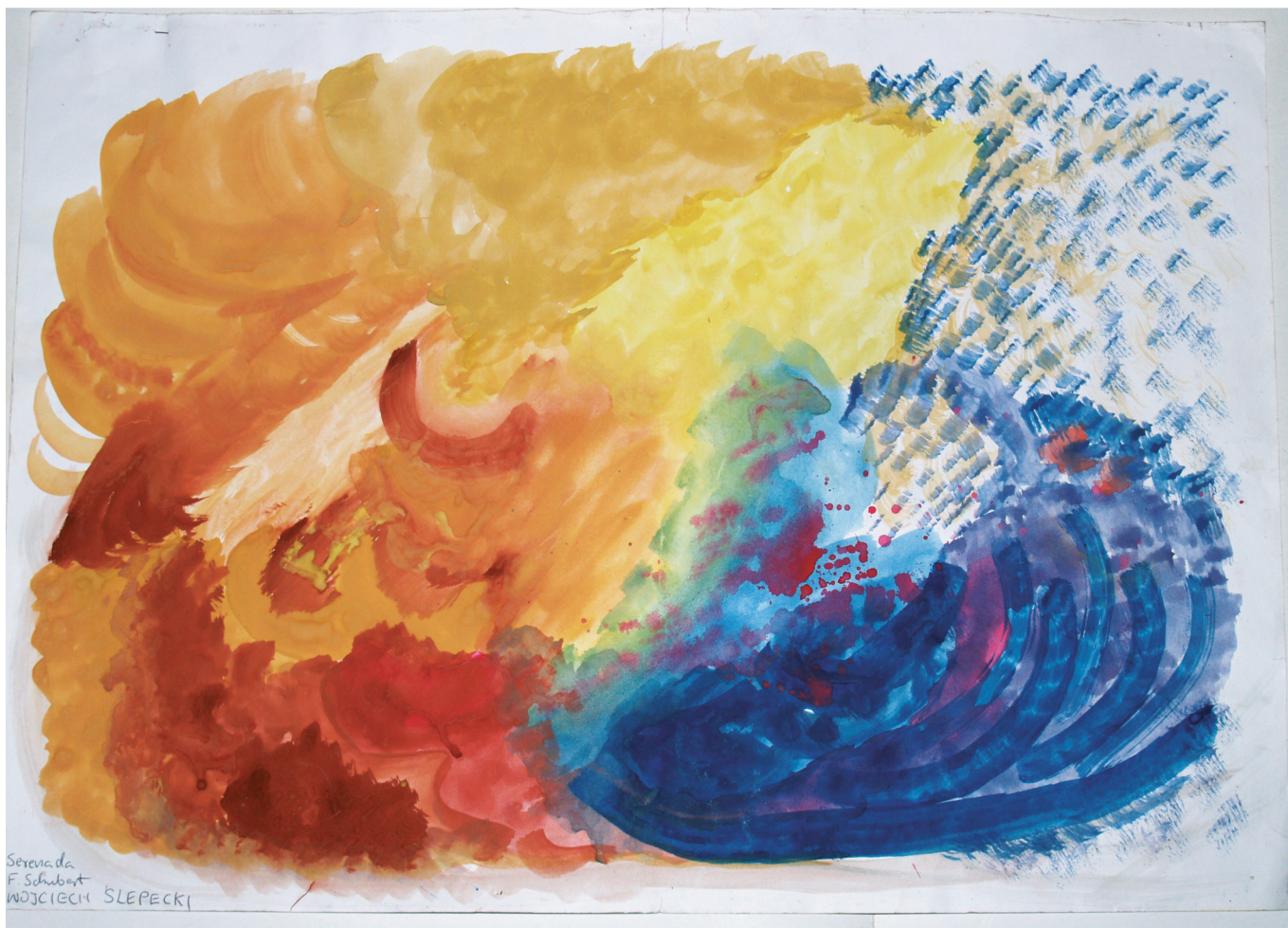
Rys. 7. Ekspresyjność i symbolika — Wojciech Ślepecki