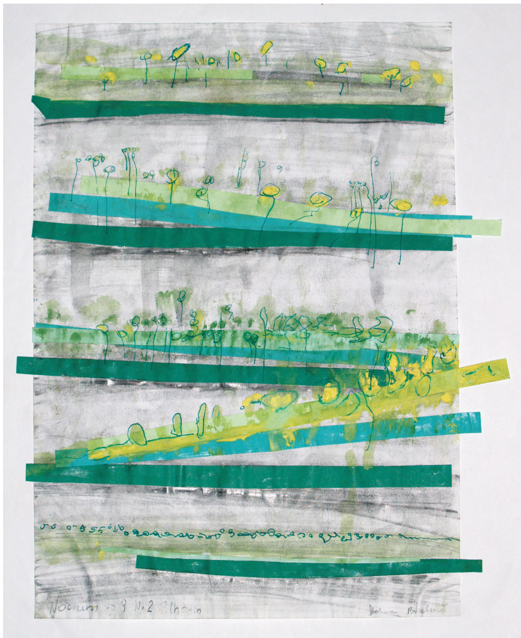
Rys. 8. Znaki muzyczne a znaki plastyczne — Halina Błachnio