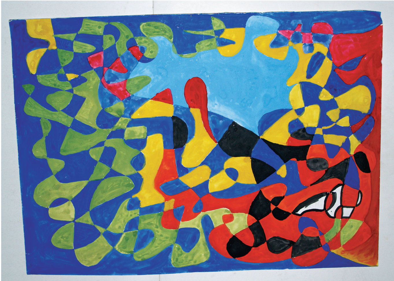
Rys. 1. Kompozycja — Mariusz Orzełowski