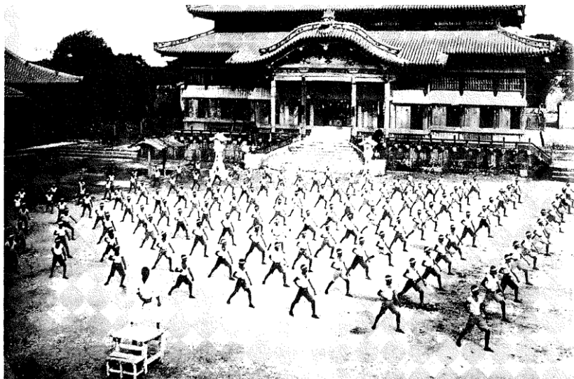
Chłopcy i dziewczęta ze Szkoły Podstawowej w Shun

Karate posiadało własności użytkowe i doskonale nadawało się jako przedmiot wychowania fizycznego. Poddawani zajęciom lekcyjnym karate uczniowie kształtowali wszystkie cechy motoryczne, ale i równocześnie kształtowali też wysokie morale postrzegane jako ważny czynnik wychowawczy i wreszcie zdobywali podstawowe umiejętności z samoobrony.